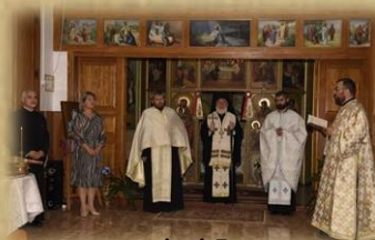
Reprezentanți ai Inspectoratului Școlar Tulcea