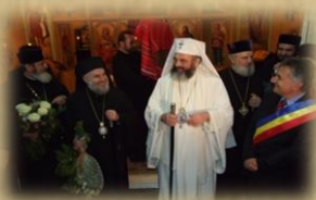
Preafericitul Părinte Daniel, Patriarhul BOR

Probele orale vor fi apreciate cu calificativul admis/respins.