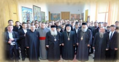
Vizita IPS Iakobos și IPS Hrisostom din Grecia