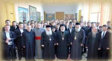
Vizita IPS Iakobos și IPS Hrisostom din Grecia