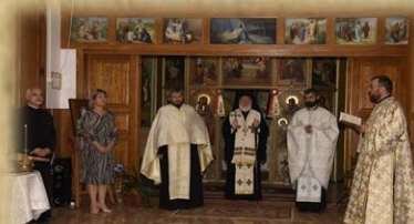
Reprezentanți ai Inspectoratului Școlar Tulcea