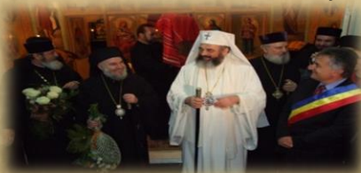
Preafericitul Părinte Daniel, Patriarhul BOR